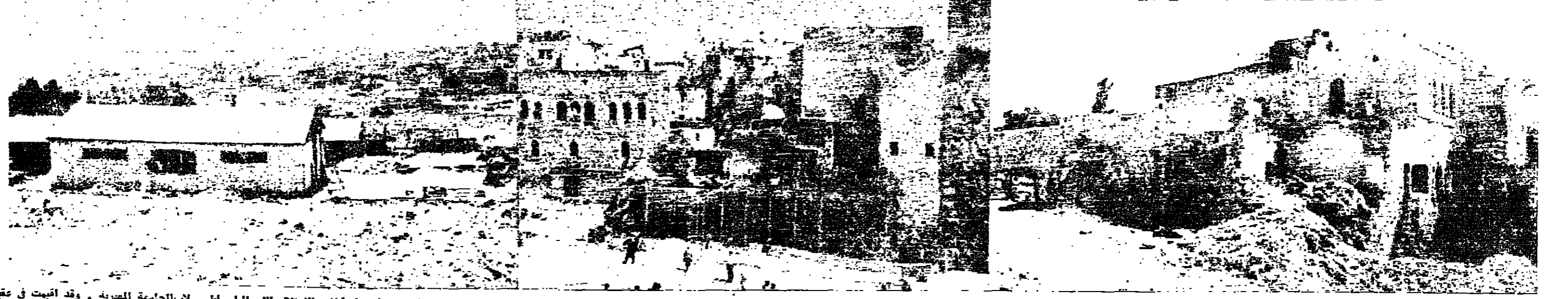
منظر للحي في زاوية ابو السعد الفخرية في القدس - وهناك خلابين وزارة الدفاع ووزارة الامانة - الوزراء في اسرائيل عن سؤول المهادرة القطة بعد هدم بيتها - ولكنهم جميعا يتفقون على الهم